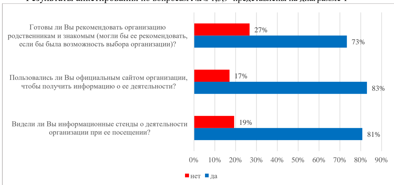
Диаграмма 1 – Вопросы анкеты №№ 1,3,9

Результаты анкетирования по вопросам №№ 1,3,9 представлены на диаграмме 1