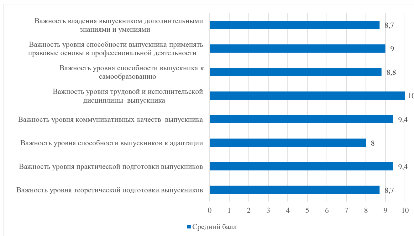
Диаграмма 2 – Средний балл оценки важности полученных знаний и навыков

Средний балл оценки представителями работодателей важности полученных знаний и навыков для выполнения профессиональных обязанностей выпускниками по видам представлены на диаграмме 2.