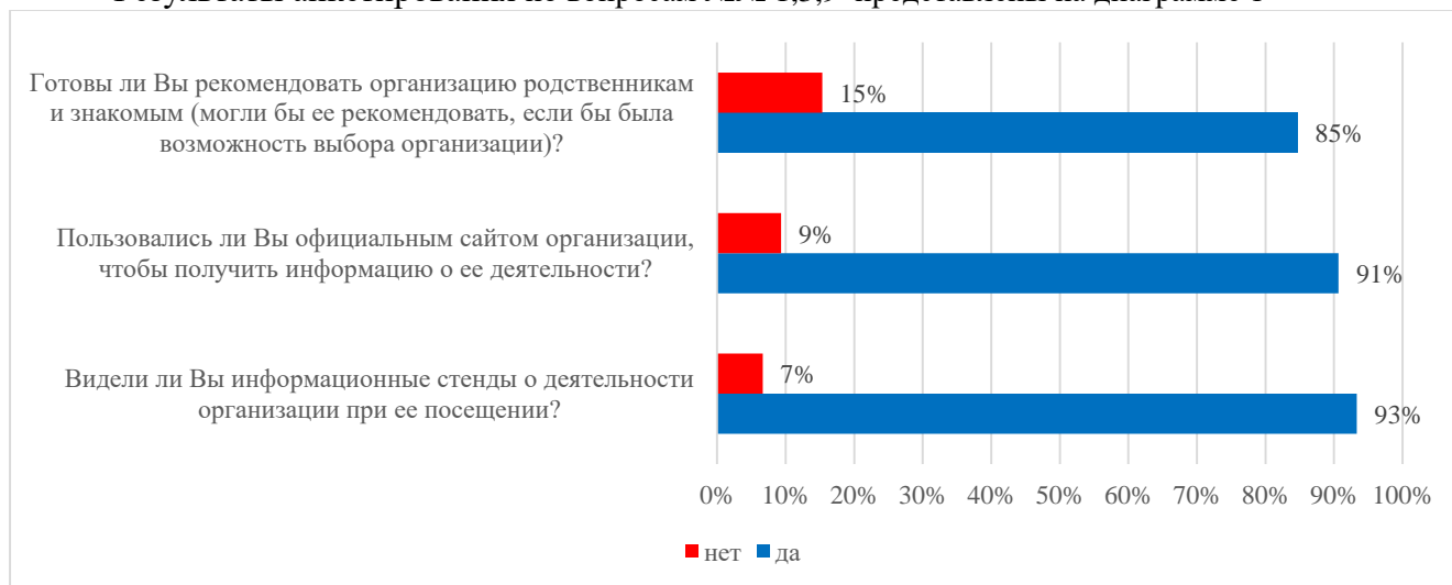
Диаграмма 1 – Вопросы анкеты №№ 1,3,9

Результаты анкетирования по вопросам №№ 1,3,9 представлены на диаграмме 1