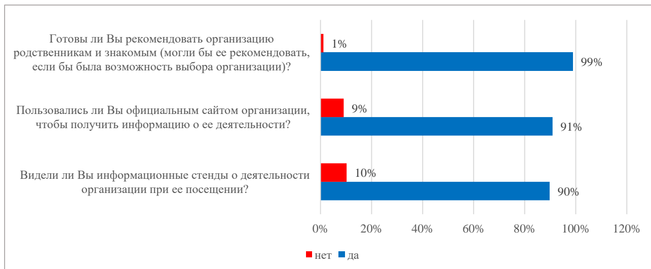
Диаграмма 1 – Вопросы анкеты №№ 1,3,9

Результаты анкетирования по вопросам №№ 1,3,9 представлены на диаграмме 1