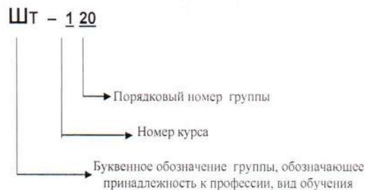
Рисунок 1 – Пример присвоения идентификационного номера группе

Каждой группе присваивается идентификационный номер (шифр) по принципу принадлежности к профессии, пример представлен на рисунке 1 для групп профессии «Штукатур»